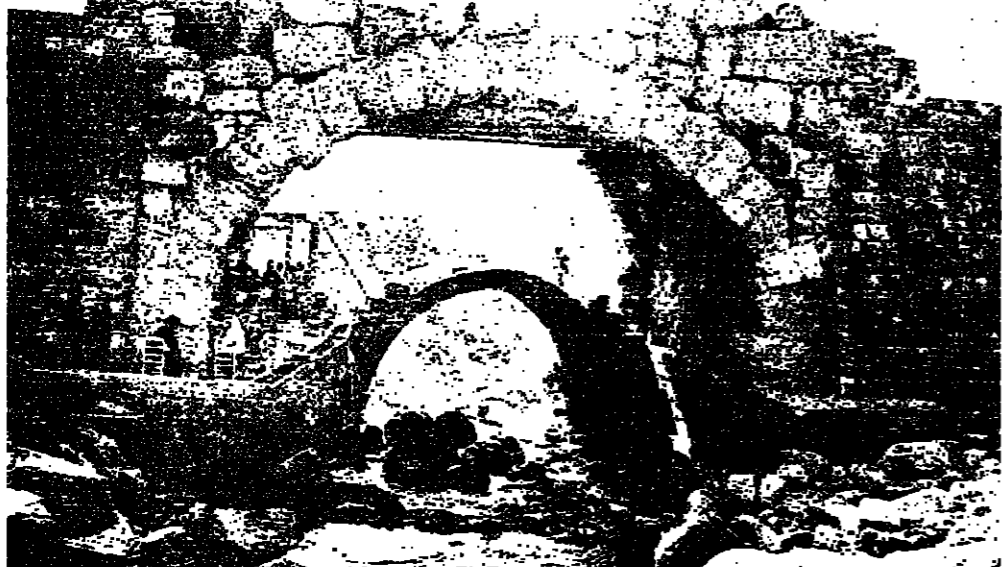
افقا: جسر فوق جسر ومقهى للناس